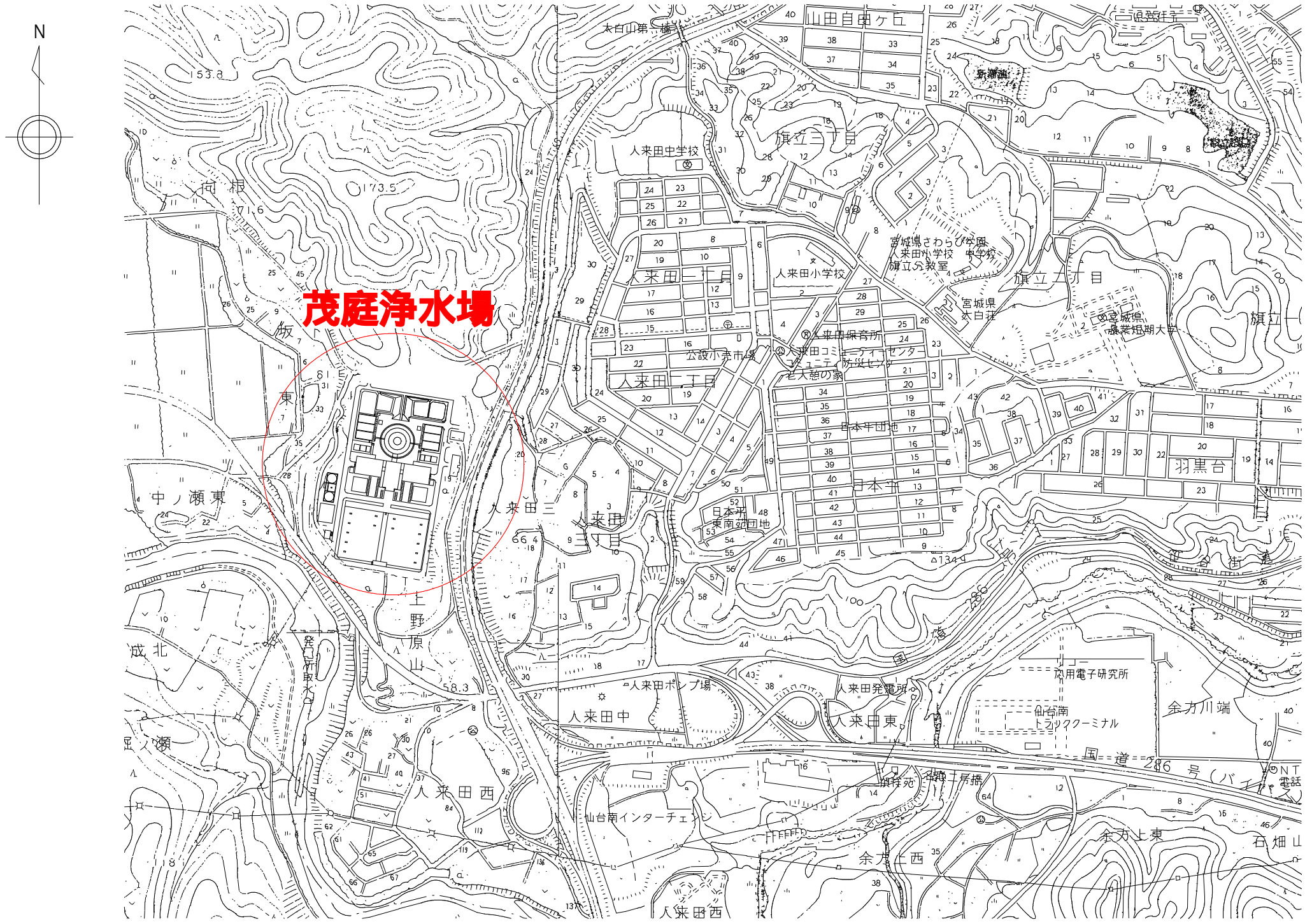
位置図 S = Free