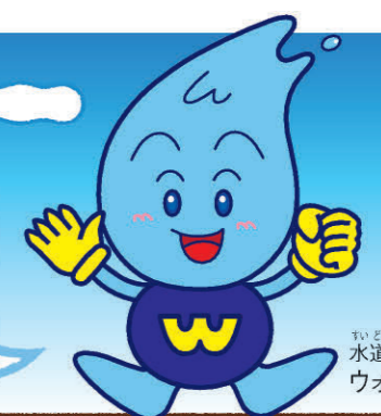
水道局キャラクター ウォッターくん

山にふった雨や雪は、川となって流れていく。川の水はダムにためられ、浄水場へと送られるよ。浄水場できれいになった水は、地面の下の水道管を通過して、みんなの家まで届けられているんだ。