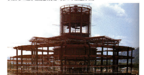
茂庭浄水場本館建設の様子(第4次拡張事業)