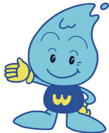
仙台市水道局 キャラクター 「ウォーターくん」