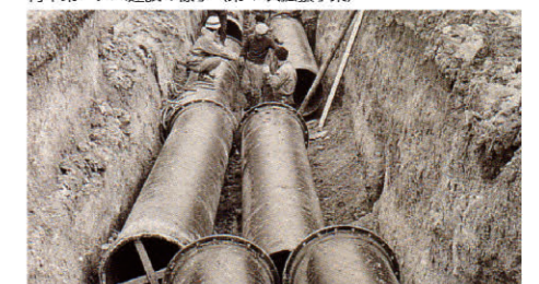
安養寺の送水管敷設現場(第3次拡張事業)