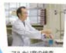
アルカリ度の検査