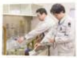
〈浄水場〉浄水場でつくっている途中の水も検査します