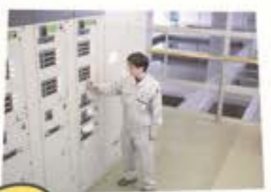
水中の細かな不純物をこし取る「ろ過池」の機械操作の様子

A 24時間休むことなく水を作っているからです。いつでも安全な水をお使いいただけるよう、24時間365日職員が交代で浄水場を稼働させています。