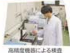
高精度機器による検査

A 色やにおいのほか、放射性物質も検査しています。高精度機器や顕微鏡、人の感覚など、様々な方法で検査を行い、健康に影響がない安全な水であるかを確認しています。