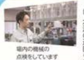
場内の機械の点検をしています

A 水質を監視しながら、つくる水の量を調整しています。大雨が降ったときや、季節によって水質は変化します。浄水場では、毎日注意深く水質を監視して、浄水場内の機械の動きをコントロールしています。そのほか、川やダムがきれいな状態かどうかを確認するために、水源の巡回も行っています。