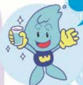
水道局キャラクターウォーターくん