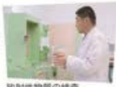
放射性物質の検査