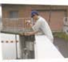
〈水源〉ダムや河川の水を監視して浄水処理に反映しています