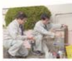
〈蛇口〉市内5区26カ所で検査しています

A 約70カ所で定期的に検査しています。法律に基づいて、家庭などの蛇口の水を検査しています。そのほか、浄水場や水源の水も検査しています。