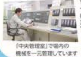
【中央管理室】で場内の機械を一元管理しています