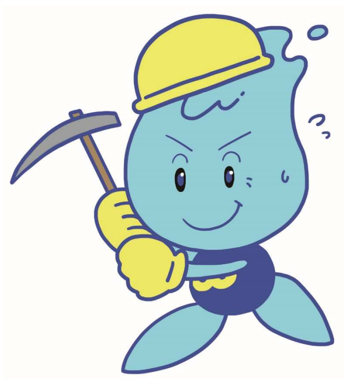
仙台市水道局マスコットキャラクター “ウォーターくん”